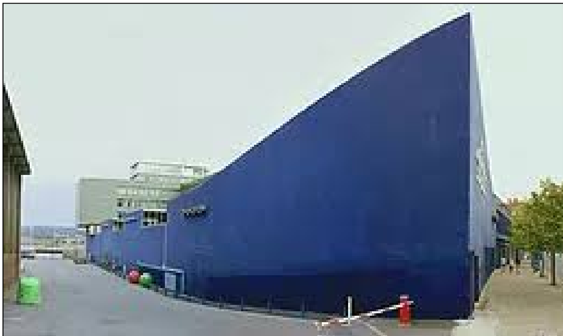
Foto: Escuela Náutica de Portugalete. SEDE de las Jornadas